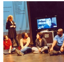
Communication for Development Malmö högskola