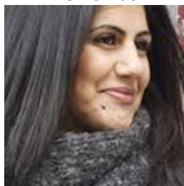
Golnaz Hashemzadeh Bonde författare