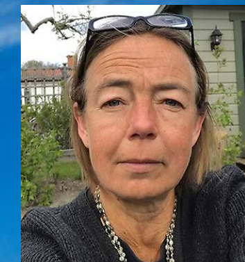
Cecilia Heyman Widmark Biblioteket