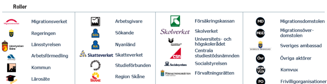
Figur 2. Etableringens fem processer och all de aktörer verksamma med insatser inom etableringens olika processer (från Nyanlända akademiker - snabb väg in på arbetsmarknaden - Region Skåne 2018).

Arbetsförmedlingen har tillsammans med Malmö universitet och Malmö stad genomfört ett antal snabbspår för lärare och förskollärare på arabiska. Denna insats har möjliggjort att nya resurser kunnat bibringas skolverksamheterna i staden.