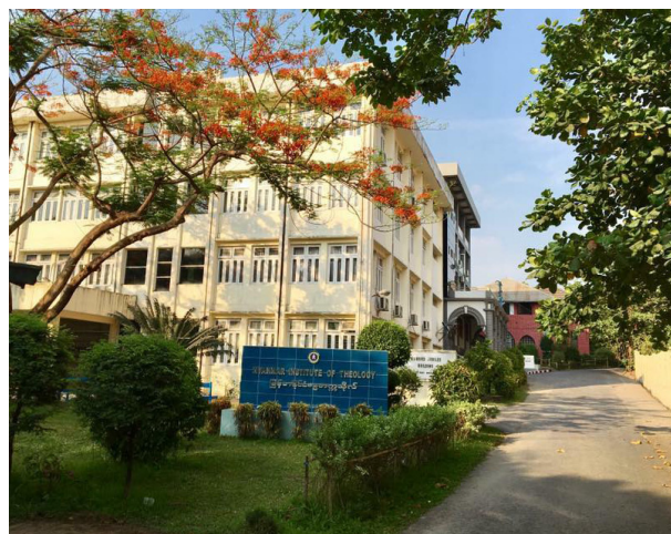
Myanmar Institute of Theology, Yangon

Med Åbo Akademi samverkar EHS bland annat ifråga om forskarutbildning, jämför ovan "Forskningsutveckling".